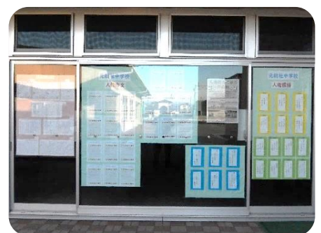
元北小学校・元総社中学校の展示 (中庭南側)