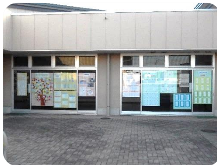
展示全体の様子 (中庭中央)