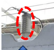
パンタグラフに採用されている部分