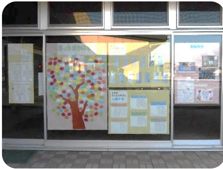
元小・元南小・元北小学校の展示 (中庭北側)

最後に、この作品展にご協力いただきました学校関係者の方々へお礼申し上げますとともに、地域の皆様には、今後とも元総社地区の人権啓発にご協力をお願い申し上げます。