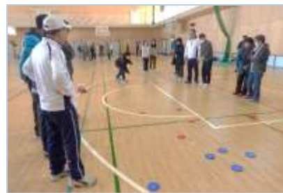
↑ 的を狙ってディスクを投げます。的自体も移動するので、試合に動きがあり盛り上がります。

2月24日(日)、元中体育館で元総社地区ディスコン大会が開催されました。22チーム、総勢100名(選手・審判)が参加しました。ディスコンは、現在普及途中の新スポーツで、昨年度から初めて地区大会の種目となりました。当日は、各チームにより熱戦が繰り広げられました。上位結果は下記のとおりです。