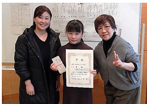
優勝した 「大友町さくら」チームの皆さん