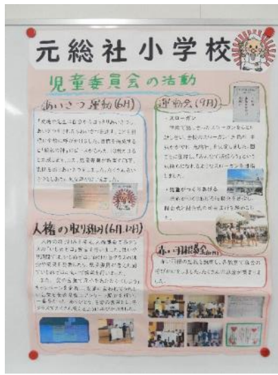
元総社小学校児童委員会