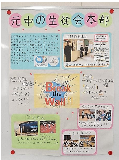
元総社中学校生徒会本部

元総社の子どもを明るく育てる活動 善行表彰は、学校・家庭・地域において善行、社会奉仕・文化活動等で貢献した児童・生徒を表彰し、その功績をたたえ激励する活動を行っています。この度、今年度の善行表彰の表彰団体・個人が決定いたしました。(関係団体:元総社地区自治会連合会・青少年健全育成会)