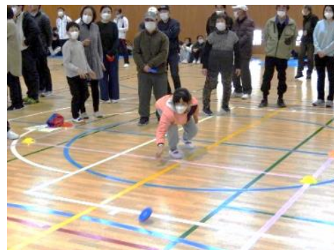
投げたディスクの行方は...!!