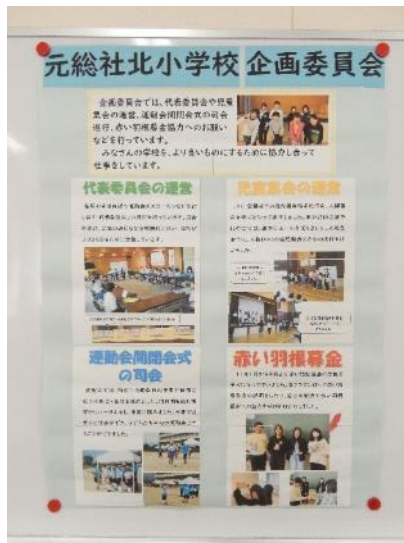
元総社北小学校企画委員会

公民館では、表彰団体の活動内容を広く地域の皆さんに知っていただきたいと思い、活動内容をまとめたパネルを展示いたします。上記団体の詳細な活動の様子は、2月28日(水)から3月27日(水)まで、公民館ホール廊下の窓沿いに展示し、外側からご覧いただけるように展示いたしますので、ぜひご覧ください。