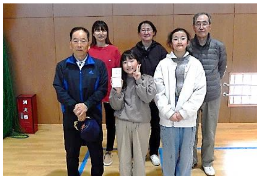
優勝した 「大友町ぎんなん」チームの皆さん