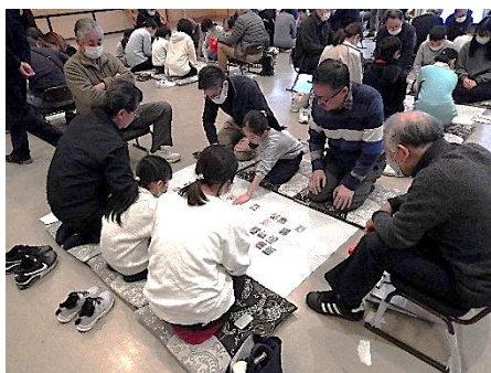
力を合わせて熱戦を展開

ご参加いただいた選手の皆様、また、読み手や審判など大会運営にご協力いただきました皆様に感謝を申し上げます。