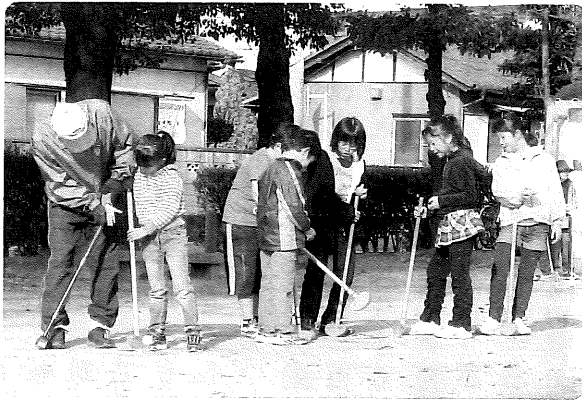
三世代 グラウンドゴルフ大会