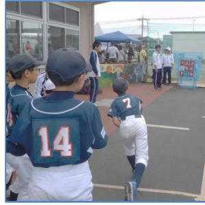
↑ねらいどおり当たるかな？