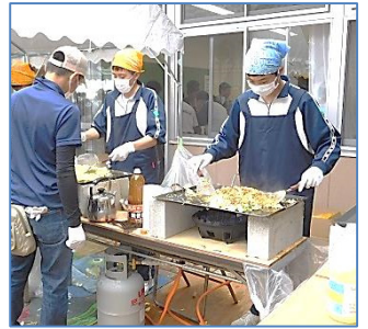
↑中学生ボランティアのみなさんも大活躍で、焼きそばは大好評でした。

5月13日(日)朝8時45分から、元総社公民館(市民サービスセンター)を会場に、恒例となりました「第34回 のびゆくこどものつどい・第21回 ふれあいの広場」を開催します。