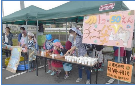
↑当日は、たくさんの模擬店でにぎわいます。