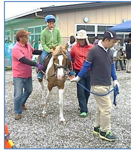
↑ポニーもやってくるよ！