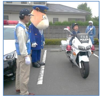
↑毎年子どもたちに人気の白バイクと記念写真撮影コーナー。

【お問い合わせ先】 元総社公民館 (市民サービスセンター) 027-251-2243 (平日のみ)