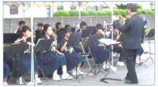
↑ 開会式のあとは、元総社中学校吹奏楽部のみなさんによる、コンサートも予定しています。お楽しみに！

【問い合わせ】元総社市民サービスセンター(公民館) 027-251-2243 (平日のみ)