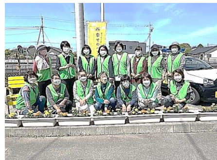
JA西部支所女性部のみなさん