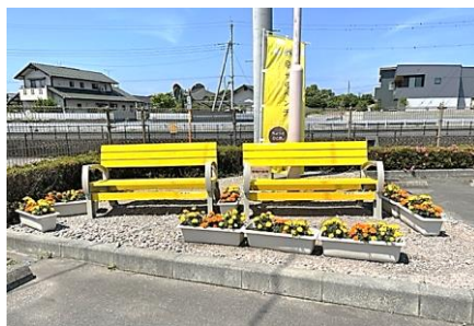
公民館西側のベンチ