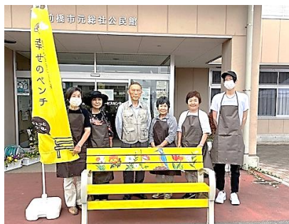
あすなるのみなさんと入口ベンチ

公民館西側に設置してある黄色いベンチ(元総社地区チャリティーゴルフ会寄贈)の休憩所は、JA西部支所女性部の皆さんによるマリーゴールドの花苗、公民館入口に設置してあるベンチは公民館利用自主グループ「あすなる」のみなさんによるペインティングにより彩られました。公民館を訪れた時、またベンチをお使いになる際には、お花と絵に元気をいただきながらほっと一息ついてくださいね。