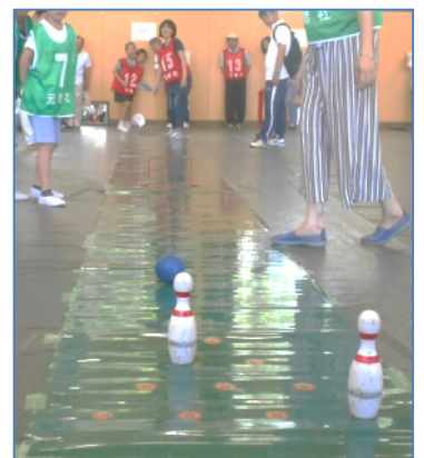
(上)本数が少なくなると難しくなりますが、この後、見事真ん中のピンに命中しました！