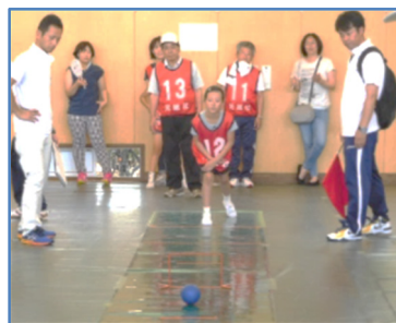
(上)きれいにゲートを通りました。