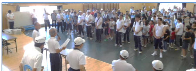
(上)表彰式の様子。暑中、大変おつかれさまでした！