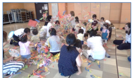
↑ 初回のアイスブレイクの回(7/4)です。色彩感覚は、幼児期の成長に良い刺激となることをテーマに、カラフルなトリコットハーフを用いたり、沢山の色のお花紙を使って紙ふぶきにしたり、まとめてボールにしたりして遊びました。