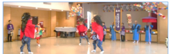
写真は昨年度（H29）の伝統芸能発表の様子です。