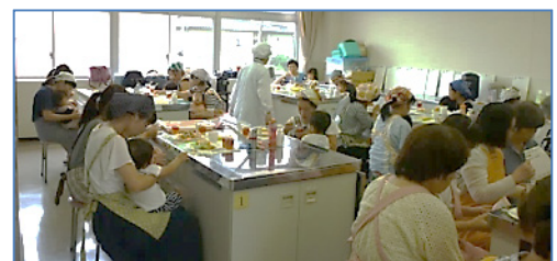
↑ クッキングの回(8/31)では、簡単に出来るフルーツゼリーや、きなこバナナ、おふすなックなどのおやつを作り、最後にお子さんと、託児担当のみなさんと一緒に試食をしました。

また、参加者のみなさま、貴重なお時間のところご参加いただき、誠にありがとうございました。いただいたご意見をもとに、より良い講座となるよう努めていきたいと思っております。お子さんの年齢が合いましたら、ぜひ来年もご参加いただけますと幸いです。