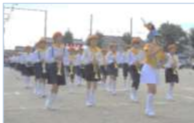
↑元北小のみなさんによる鼓笛演奏