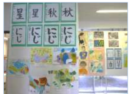
↑絵画、書道など様々な種類の作品が展示されます。地域のみなさん、小中学校や保育所のみなさんの作品がたくさん並びます。