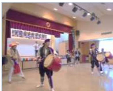
↑舞台発表では、ダンスや歌など、たくさんの種類の発表があり、会場を盛り上げます。写真は沖縄民謡です。