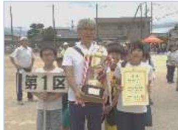
↑昨年に続き、1区が優勝しました！おめでとうございます。