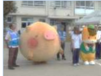
↑今年も「ころとん」と「ぐんまちゃん」が参加してくれました！