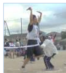
↑一番乗りでゴールです！