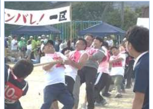
↑綱引き決勝は、どちらも一歩も譲らず、迫力のある試合が続きましたが、見事11区が勝利しました！応援も大変盛り上がりしました。