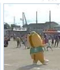
↑「ぐんまちゃん」は親子体操に参加し、子供たちと楽しく踊りました。