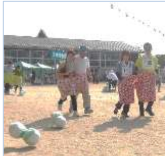
↑デカパン競争では、変形ボールの行方に苦戦しつつも協力してゴールを目指しました。