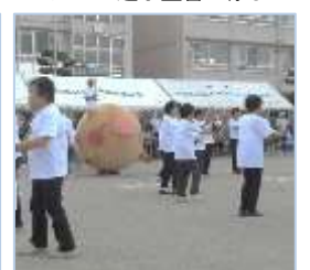
↑「ころとん」は、老人クラブ女性部の皆さんによるオリンピックをテーマにした踊りに登場