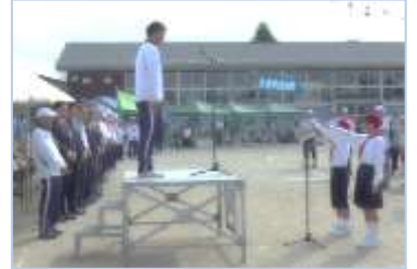
↑開会式にて、昨年優勝区(1区)の代表子どもたちによる選手宣誓の様子