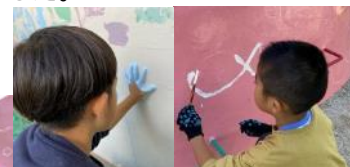
上手にできたかな？

みんなで塗装し、新しくなったタコの滑り台や壁を是非見に行ってみてください！ さくら公園が綺麗に今後も長く愛される公園でありますように！！