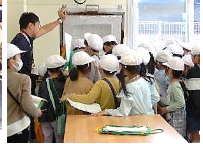
元総社小学校2年生の皆さん