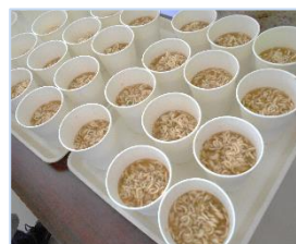
↑水を入れて、長めに時間をおくことでラーメンを調理しました。