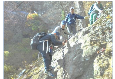
↑ 急な傾斜も、協力して登りきりました！