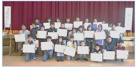
↑昨年度、善行表彰にて顕彰されたみなさんです。

【問い合わせ】元総社公民館(市民サービスセンター) 027-251-2243(平日のみ)