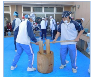
↑今回も恒例のもちつきを行います！