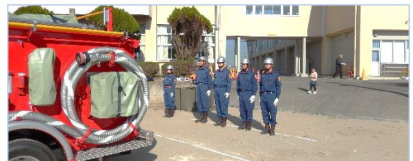
↑消防団のみなさんの連携により、手際良く放水訓練が行われました。