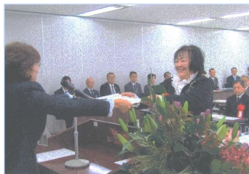
↑教育長からの感謝の言葉とともに表彰状が授与されました。

長年に亘って、地域の子育てを支えてきたご活動に敬意を表すると共に、この度の表彰をお祝い申し上げます。