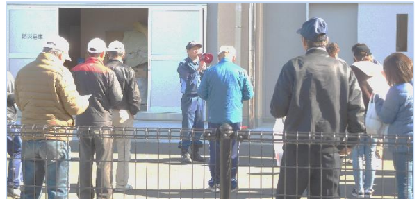
↑施設安全点検では、中学校内の各施設を歩いて見て回りながら、危機管理室の指導により、避難時の活用方法を学びました。

日頃より危機意識を持ち、地域での連携を強化していきたいと思っております。今回、訓練開催に協力いただきました地域住民のみなさま、元総社中学校先生方、自治会関係者、消防・防災関係者各位にお礼を申し上げます。