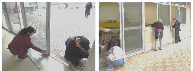
↑普段行き届かない細かいところも一つ一つ、手作業でお掃除していただき、館内は随分ときれいになりました。今後とも、協力し合って清潔に保っていきましょう。

来年も、気持ち良く新年を迎えることが出来るそうです。ご協力いただきましたみなさんに深くお礼を申し上げます。