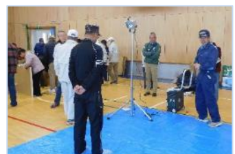
↑発電機の作動や、段ボールベッドの組み立てを行いました。