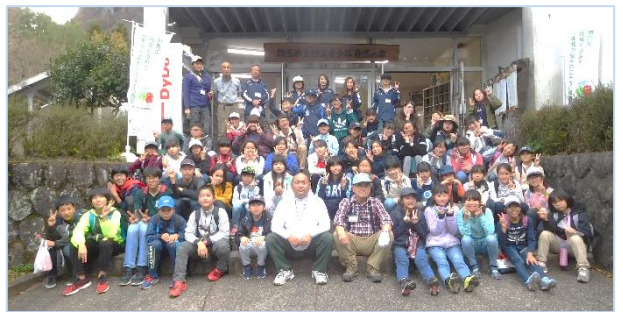
↑ 全員で集合写真を撮りました。みんな良い笑顔です。

参加した児童の皆さん、子育て連本部役員の皆さん、お疲れさまでした。また、運営に協力して下さったシニアリーダーの皆さん、本当にありがとうございました。