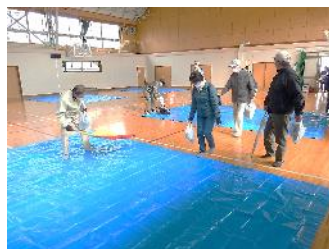
安全が確認された体育館内へ移動。自治会ごとに分かれてブルーシートに着座（元総社南小）