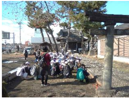
菅原神社で神社の歴史について学ぶ児童たち