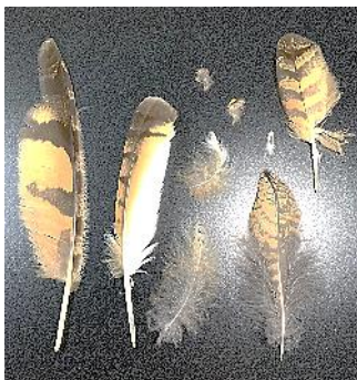
ベンガルワシミズクの様々な羽

こここのところ寒い日が増えてきましたが、フクロウ達は全身をおおうフワフワの羽でいつも暖かそうです。実は、この羽にもさまざまな種類や役割があります。そこで、何回かに分けてこのフクロウの羽のヒミツを深掘りしていきたいと思えます。