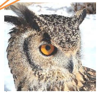
顔の周りには細かい羽根がたくさん生えています！！