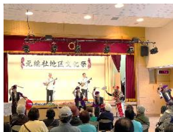
三線と太鼓のリズムで沖縄民謡 『群馬エイサーシンカ舞人』