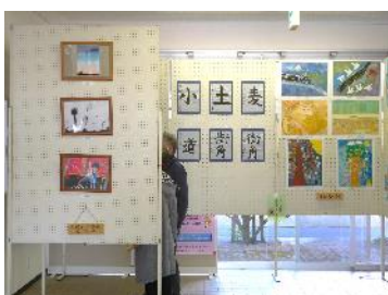
小・中学校による書画の展示 皆さんありがとうございます