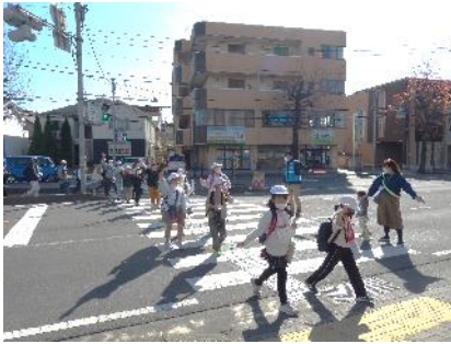
児童たちの安全確保のため、交通指導を行う青少年育成推進員さん

なお、菅原神社では、神社の歴史について分かりやすい説明を受け学び、無事終了しました。