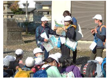
元南小かるたを使って地域について理解を深める児童たち