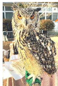
全身の様子(お腹側、背中側では模様や色がちがいます)