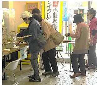
野菜350g量れたかな? 『食生活改善推進委員会』