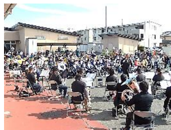
青空の下で爽やかに♪ 自主グループ『アンサンブル響』