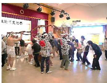
大数珠くぐりで疫病退散! 『大友町百万遍保存会』