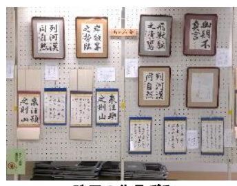
珠玉の作品ぞろい 自主グループ『書道あをみ会』