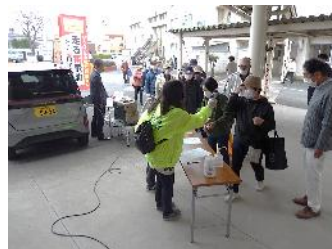
受付では体温を測り、手指を消毒。受付名簿に名前などを記載し体育館へ（元総社北小）