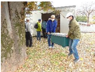
防災倉庫から「避難所開設キット」などを出し、体育館入口へ運んで受付を設置（元総社小）

また、群馬トヨペット、カローラ群馬、ネットヨタ群馬、群馬日産の各社のご協力によって、電気自動車による給電など災害時における活用法の説明をしていただきました。