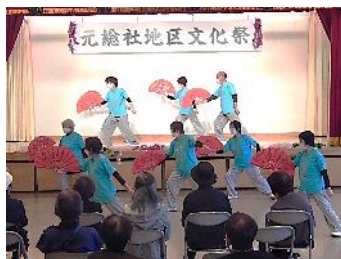
赤い扇子が印象的 自主グループ『総拳NEXT』