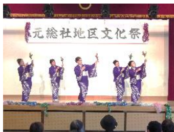
真室川音頭を披露 『上石倉むらさきの会』