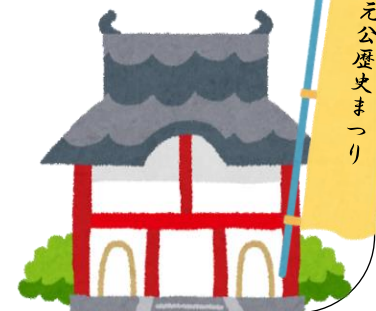
秋元公歴史まつり