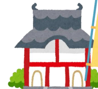
秋元公歴史まつり