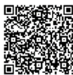
混雑予想 カレンダー