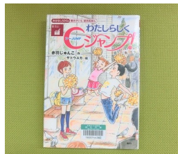
「おはなしSDGs 働きがいも経済成長も わたしらしくCジャンプ!」

新聞雑誌閲覧コーナー、読書スペースは座席数を制限して開放します。2時間ごとに消毒を実施します。