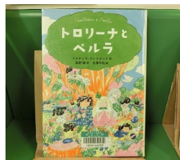
「トロリーナとペルラ」

新聞雑誌閲覧コーナー、読書スペースは座席数を制限して開放します。2時間ごとに消毒を実施します。