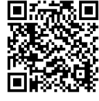
混雑予想 カレンダー