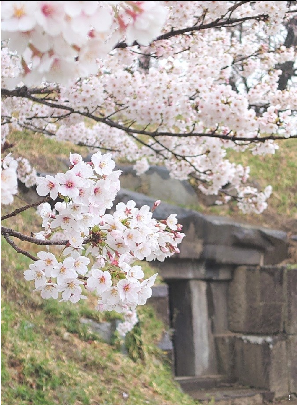
古墳の上に咲いている桜の花