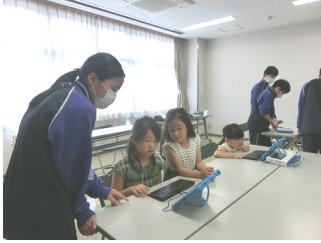
タブレットであそぼう！