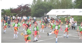
3園共同の幼児たんべえ