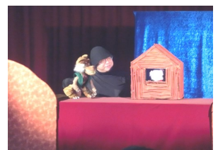
↑昨年開催した人形劇(三匹のこぶた)より

※申し込まれた方は全員観覧可能です。万が一開催が中止になりましたら、メールまたはお電話でお知らせします。