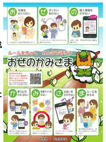
おぜのかみさまのチラシ

群馬県及び前橋市では、青少年が夏の長期休暇を迎えるにあたり、『県民総ぐるみで次代を担う子どもたちの健全育成に取り組もう』を推進目標に夏の青少年健全育成運動を令和3年7月15日(木)から令和3年8月31日(火)までの期間に行います。「おぜのかみさま県民運動」を推進し、地域と家庭で子どもたちの安全・安心なインターネット利用を考えましょう。