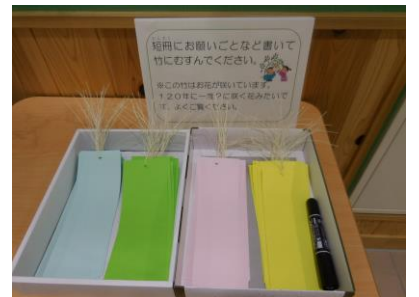
設置してある短冊