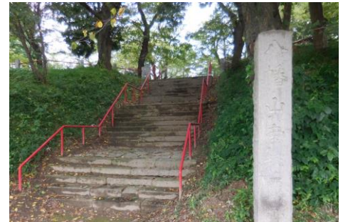
八幡山遺跡(聖霊殿)入口

八幡山の名が示すように、八幡神、すなわち封建時代に源氏の守護神として崇拝された武神が祀られていたものと考えられる。周囲には堀状の溝を巡らし、砦のごとき観を呈して。鎌倉時代は、東毛に新田源氏があり、上野一円に勢力を伸ばし、この地も勢力下であったと考えられる。