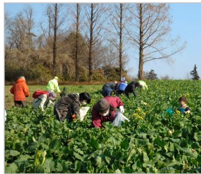
一昨年の摘み菜の様子