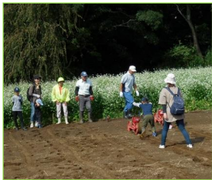
一昨年の種まきの様子