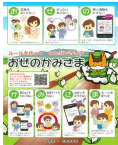
おぜのかみさまのチラシ

群馬県及び前橋市では、青少年が年末・年始を迎えるにあたり、『県民総ぐるみで次代を担う子どもたちの健全育成に取り組もう』を推進目標に冬の青少年健全育成運動を令和3年12月15日(水)から令和4年1月31日(月)までの期間に行います。「おぜのかみさま県民運動」を推進し、地域と家庭で子どもたちの安全・安心なインターネット利用を考えましょう。