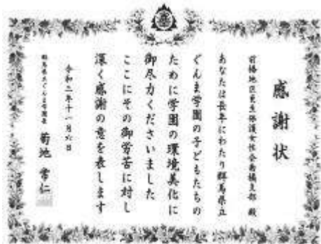
ぐんま学園からの感謝状

当会では2017年秋から園内と学園南側道路沿いに、子どもたちとその子を支える先生方を応援するために花を植え、外の花壇は近隣の皆さんに学園のことを理解していただけるようお願いをしています。この度、この取り組みに対して学園から感謝状を頂戴しました。ありがとうございます。当会では思いやりのある地域社会を目指し、青少年の健全育成活動をはじめ広く更生保護の学びに取り組み、輪を広げる努力をしています。