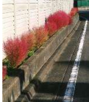
植栽した花(コキア)