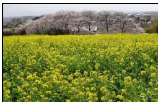
菜の花の観賞・摘み菜の時期

申込・問合せ=南橋地区地域づくり推進協議会事務局(南橋公民館内) 電話=231-2376