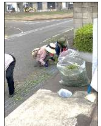
暑い中、除草作業をする会員のみなさん