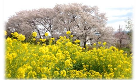
田口菜畑の菜花と桜【4月12日の様子】