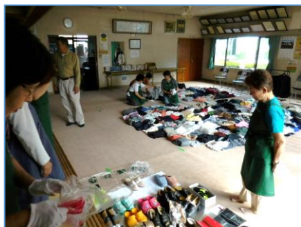
持ち込まれた衣類、書籍、日用雑貨品など

秋の衣類等交換会は、春と同じ南橋町第2集会室を会場に行いました。参加者や品物は、春の半分ほどでしたが、持ち込まれたほとんどの物が新しい持ち主に引き取られて行きました。