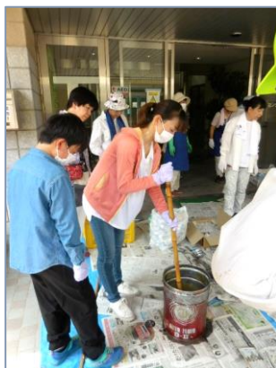
廃食油を加えキャラメルのように になるまで掻き混ぜる