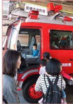
北消防署見学（10月28日）