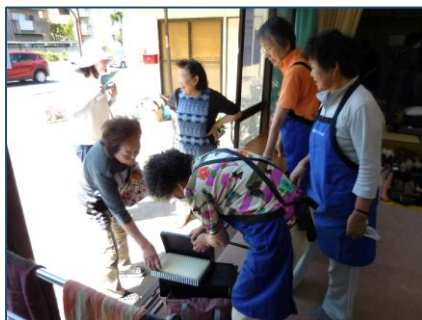
古着・日用雑貨品等交換会品の受付

「南橋リサイクルの会」主催の衣類等交換会が、南橋町第2集会室で、150人を超える皆さんの参加で開催されました。公民館ホールに比べれば狭くはなりましたが、不用となった衣類や日用雑貨品、書籍が多く持ち込まれ、盛会な交換会となりました。