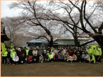
日輪寺境内の桜の下で記念写真

今年で8回目。桜はまだ1分から2分程度の開花でしたが、73名の参加者は、今にも開きそうなピンク色の蕾や開いたばかりの花びらを愛でながら、約4km、1時間40分の散策を楽しみました。