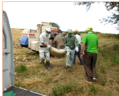
刈取った菜種はハウスに運び、2～3か月乾燥させます