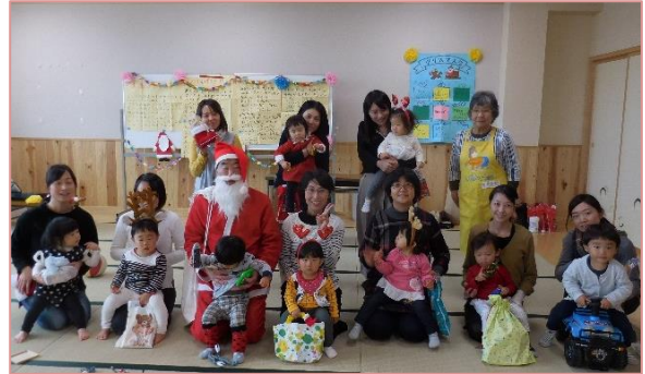
クリスマス会（12月9日）