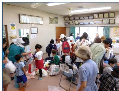
交換会終盤の様子