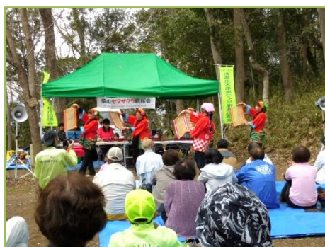
「SAKURAの会」の大正琴演奏 と南京玉すだれの妙技

全般的には花見には少し早い様子でしたが、7～8分程度咲いている木もありました。当日は、薄曇りで時折肌冷たい風が吹く中、100人を超える皆さんの参加をいただき、大正琴、オカリナ、アコーディオンの演奏やみんなで合唱したり、皿回しや南京玉すだれの妙技も参加し、楽しい1時間半の「山の音楽会」でした。また、事前に新聞に載ったためか、遠くは太田市や藤岡市の方もお見えになりました。