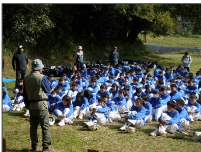
橘山について学習

今年も、南橘中1年の生徒・先生150人余りと田口町自治会や橘山憩いの森愛護会の皆さんが橘山の環境整備活動を行いました。身近な里山「橘山」についての学習や実地見学、草刈り班、ロープ班、巣箱班、樹名板取付け班、のぼり班に分かれての共同作業など、教室では学べない貴重な体験となっています。