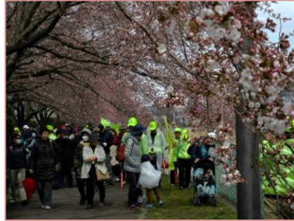
関根薬師公園付近