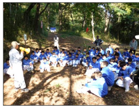
午後の実地見学（ヤマザクラ植樹地）