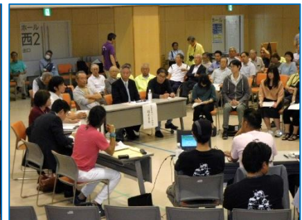
パネルディスカッション ～地域づくりと新しい前橋～