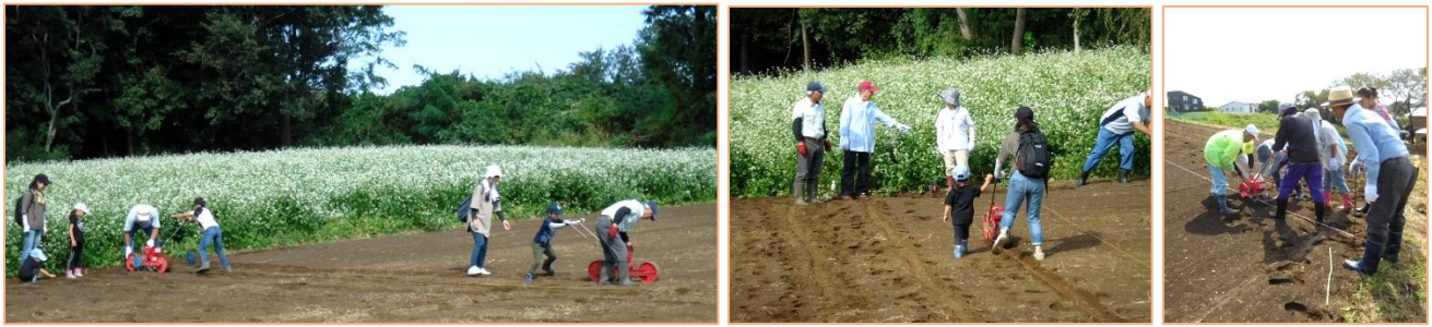
みんな協力して種まき・エコクラブのこども達もがんばりました