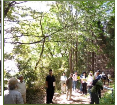
白い花が満開の「エゴノキ」