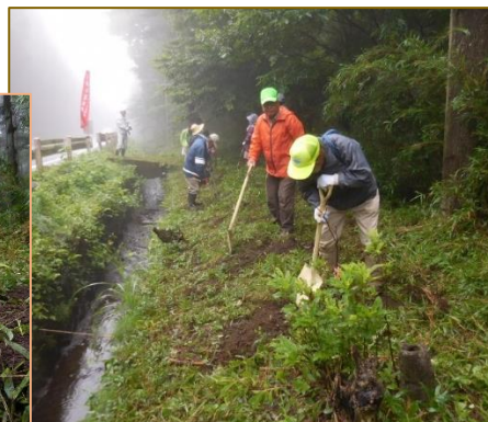
4班に分かれて植栽