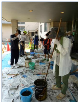
苛性ソーダを水で溶く

リサイクルの会の皆さんに指導をいただき、応募いただいた2家族4人が参加し、苛性ソーダに水と廃油を混ぜ掻き混ぜる作業や牛乳パックに入れて蓋をする作業など、廃油石鹸づくりの体験を楽しみました。最後に、自分たちで作った給食用牛乳パック入り石鹸が記念品になりました。