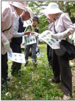
「ハルジオン」を観察

身近な里山の草木や生き物を観察しながら、日頃見過ごしがちな自然に楽しく触れることができました。