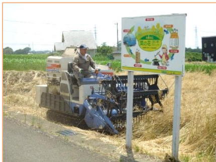
6千㎡程の田口菜を機械で収穫

渋川市赤城町のそば組合に委託し、機械による刈取りを行いました。今年は、収穫面積も広がったため、一昨年を超える23袋の菜種が収穫できました。収穫した菜種は、菜種油と油粕をつくるために、2～3か月乾燥させます。