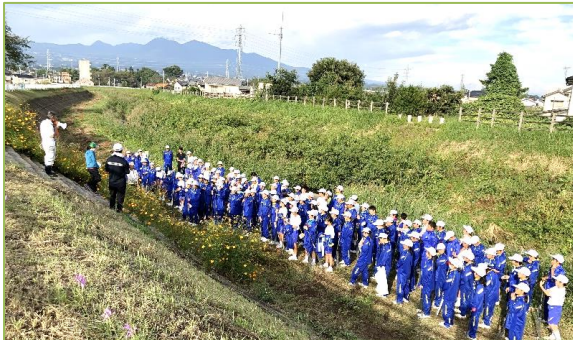
作業前の龍蔵寺町自治会長さんの作業説明

今年も、鎌倉中学校1学年の生徒・先生120人余りが、龍蔵寺町の地域の皆さんと一緒に、赤城白川の河川清掃活動（枯れ草の集積作業や空き缶などのごみ拾い等）を行いました。