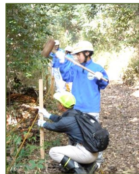
危険個所にロープ張り