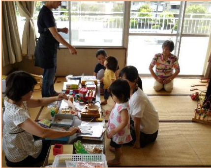
親子交流（南橋公民館2階和室）

南橋子育て井戸端サロンは、親子の友だちづくり・情報交換の場として育児ボランティアの皆さんがサポートし保護者の方が運営しています。南橋公民館で月2回開催されました。