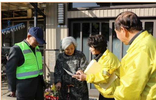
安全安心パトロール