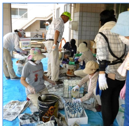
牛乳パックに入れて 固まるまで1ヵ月待つ