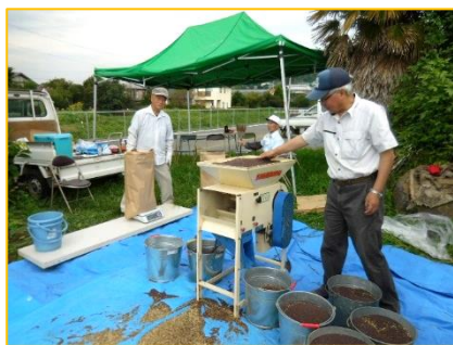
十分に乾燥させた菜種に混じったごみを「ふるい」で除き、さらに選別機でキレイにし、袋詰めします。