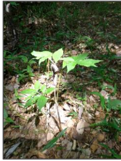
「マムシグサ」は球根で育つので花が咲くのに数年かかり、 性転換もするそうです