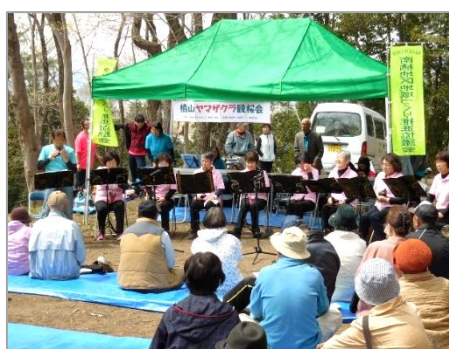
「オカリナクラブ響き」 のオカリナ演奏