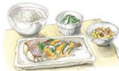
【昨年の推進大会から】