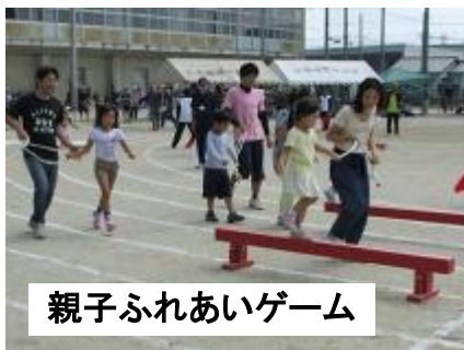
親子ふれあいゲーム