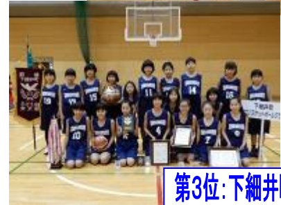
第3位：下細井町チーム