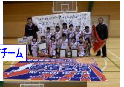
準優勝：青柳町チーム