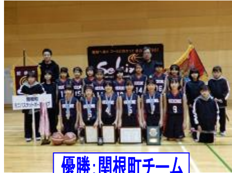
優勝：関根町チーム