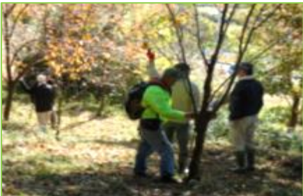
名札の確認と取替え作業