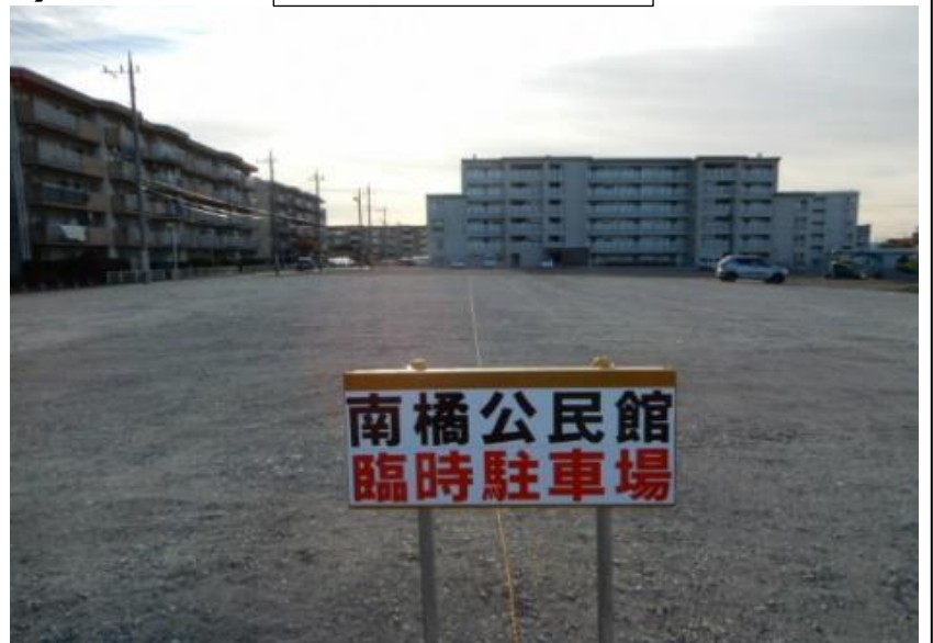
工事が完了すると駐車場の外枠に囲いができる予定です。