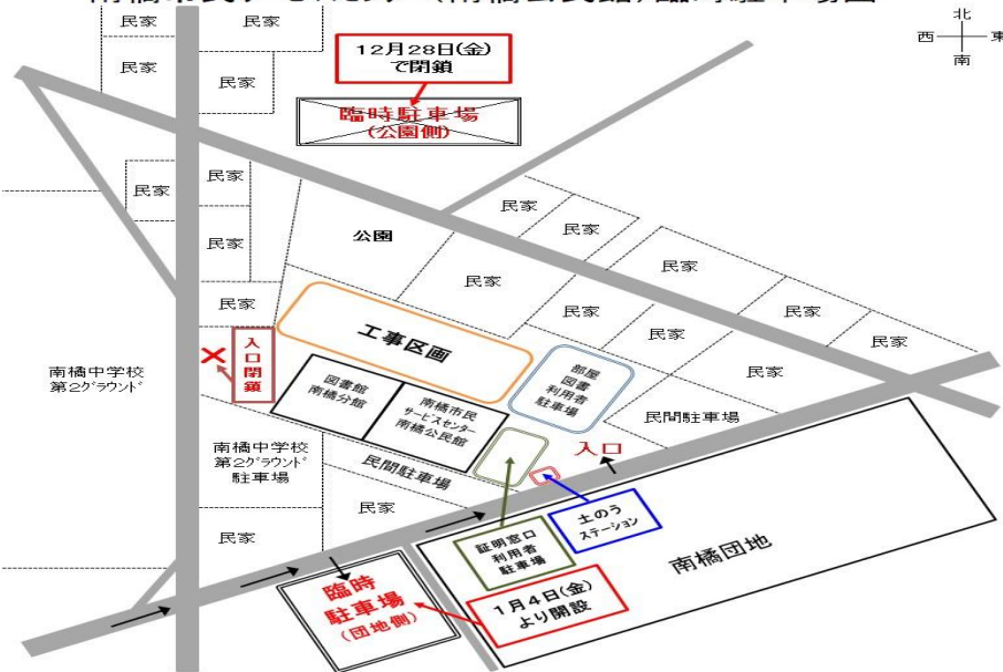
南橋市民サービスセンター(南橋公民館)臨時駐車場図