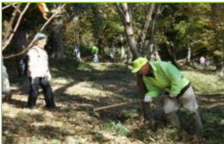
枯葉や落葉を根元に寄せる作業