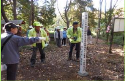
渋川市下箱田自治会が設置した山頂の標柱と「橋山の伝説」説明板