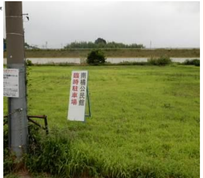
臨時駐車場の様子