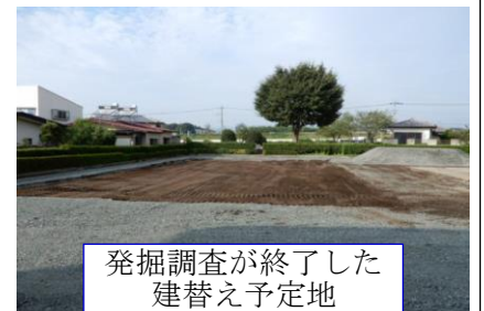
発掘調査が終了した建替え予定地

8月28日(火)、建替えに伴う発掘調査が終了しました。今回の発掘調査で古墳時代の竪穴住居跡1軒等が確認されました。建替え工事は近日中に始まる予定です。(更地に戻りましたが駐車場としては利用できません。)