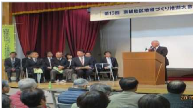
昨年度の推進大会開会式

今年度は「防災」をテーマにした特別講演を行う予定です。大会の概要や特別講演の内容は、2月号でお知らせします。