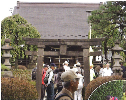
●上小出町 小出神社 =上、香集寺=右