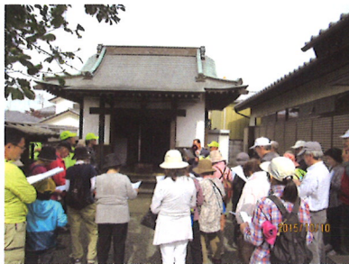
●荒牧町 お不動様=上、 荒牧神社=右