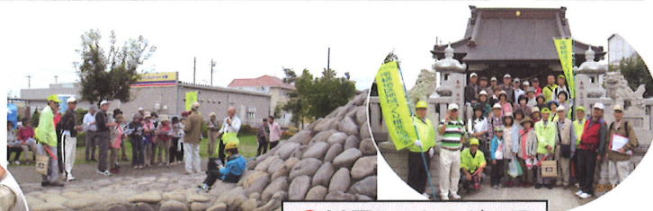
●川原町 かんがい用 水=左、市杵嶋(いち きしま)神社=右

ふるさと再発見を目的に「第三回地域探検隊」(今年度活動)が昨年十月十日に実施されました。四十五人が参加。今回は、上小出町・荒牧町・川原町の「とつておきのポイント」を見学。皆さん、南橋地域の名所や旧跡などを楽しみながら歩いていました。