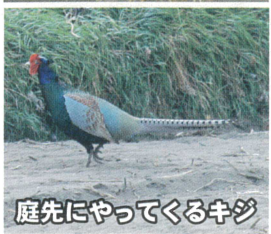
庭先にやってくるキジ