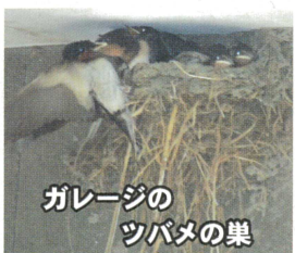
ガレージのツバメの巣

梅雨時になるとツバメがやってきます。ガレージの中に巣を作り、ヒナは約一か月程度で巣だつていきます。軒先のガレージアーチには、つるの葉の中に巣を作るためにハトが毎年やってきます。初夏になるとキジが庭先を散歩してきます。たまに親子で来ることもあります。