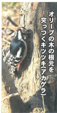
オリーブの木の根元を突っつくキツキ(アカゲラ)

春先になると多くの野鳥が我が家に来てくれます。昔はスズメが圧倒的に多かったですが、最近は一回り大きいムクドリが目立ちます。我が家に来てくる代表的な野鳥を紹介いたします。まず春先に来てきたのがキツキ(アカゲラ)です。オリーブの木の根元をひたすら突っついていきます。穴だらけです。