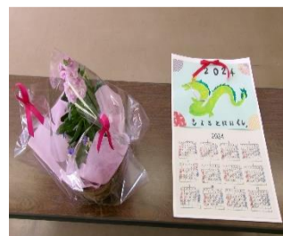
カレンダーは来年1月から掲示します