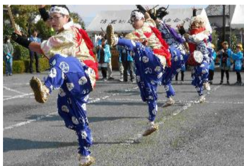
野良犬獅子舞(清野町)

■勤労感謝のプレゼント 11月の勤労感謝の日に合わせて、清里保育所の園児の皆さんが、清里公民館に生花の寄せ植えと来年の干支の手作りカレンダーをプレゼントしてくれました。公民館ロビーでご覧いただけます。