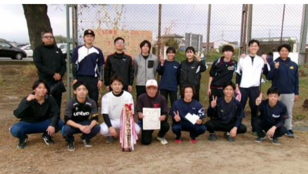
優勝した上青梨子町チーム