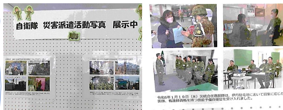
令和6年1月10日(水)災援会任務部課は、伊月駐屯地において招集に応じた医師、看護師資格を持つ技能者補員官を受け入れました。