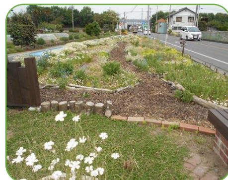
花はな花壇の様子