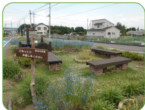
花はな花壇ベンチとイワダレ草 ごゆっくり お楽しみください!