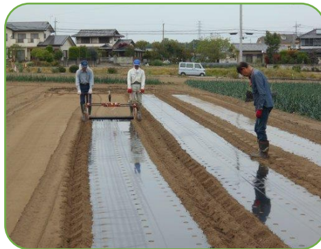
マルチ張り、ご苦勞様です。