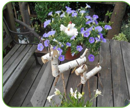
木で作った鹿の親子

我が家もオープンガーデンに参加しました。今年はバラの開花が遅れ、皆様にまばゆいほどの花を見ていただけなかったのですが、たくさんのガーデン好きな人たちとの話に花を咲かせ、楽しい一時を過ごすことができました。