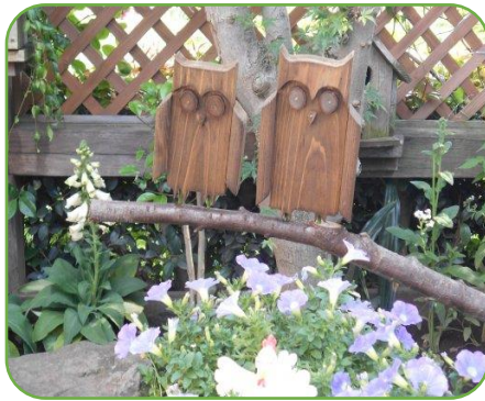
木のフクロウが2羽

中でも印象に残ったのは下川淵地区から親子で来られた方です。「小学校の新聞を作るので取材させてください。」