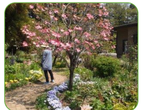
ハナミズキの咲く庭