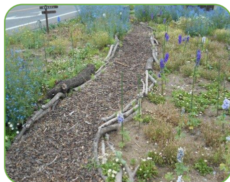
チップとパークを敷きつめた小道