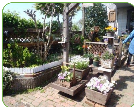
イングリッシュガーデン風の庭園