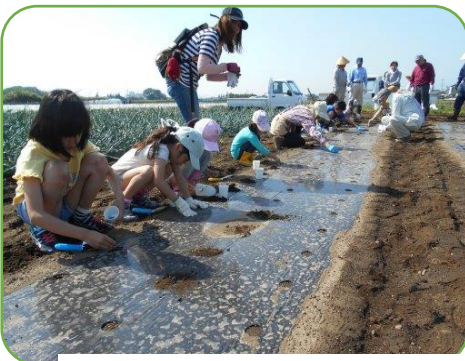
収穫が楽しみです！