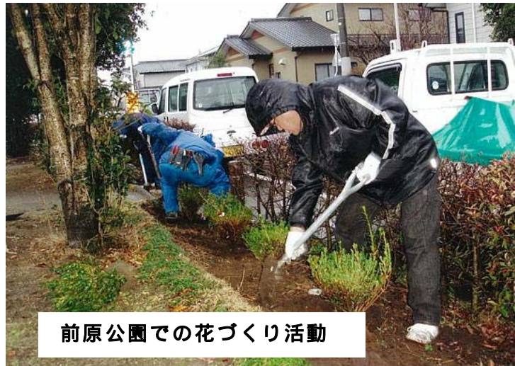
前原公園での花づくり活動

立ち寄ってください。花作りの輪が、点から線へさらに帯状となり、清里地区全域を包み込むようになる夢を皆さんで共有しませんか。