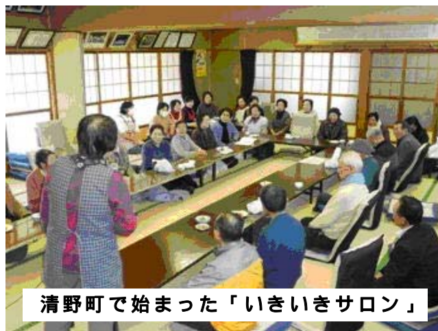
清野町で始まった「いきいきサロン」

二月十六日(月)同時間で第二回目が行われ、参加者は二十三名でした。第一回同様に転倒防止体操をした