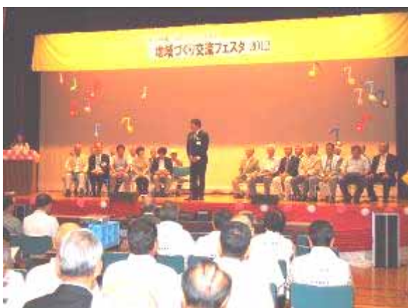
昨年の地域づくり交流フェスタのオープニング

また、毎年7月に前橋中心商店街を中心に開催される「前橋七夕まつり」に、前橋地域づくり連絡会として参加することになりました。すべての地区の地域づくり団体が参加するわけではありませんが、多くの団体が七夕飾りを出品する見込みです。清里まちづくり協議会は、七夕飾りではなく、昨年と同様に「きよさと焼」の出店を検討しています。祭りを盛り上げたいと思いますので、「前橋七夕まつり」にも、是非足をお運びください。