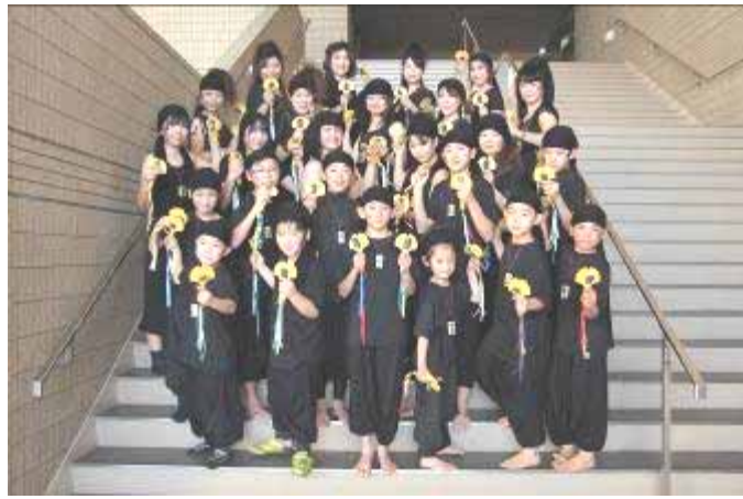
出演が終わり、揃って記念撮影

で賑やかに参加してきました。 ステージに立つ直前まで緊張感いっぱいでしたが、曲が始まったら普段の練習の成果を如何なく発揮することができたと思います。このコンテストは、5年間の私たちの活動の集大成となりました。