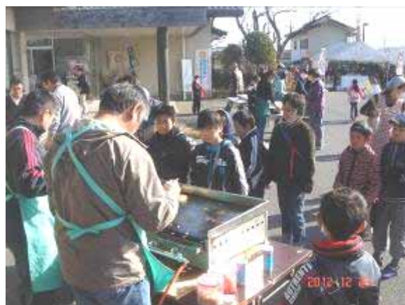
きよさと焼を求める長い行列

収穫祭が今年度の最後の行事となりましたが、多くの人達に手伝ってもらい、本当にありがとうございました。おかげさまで、前橋市からの行事参加の依頼も増え、断ることも多くなるほどです。少しずつ、きよさと焼が認められている、という実感となってきました。来年度は是非一緒にきよさと焼を焼いてみましょう。