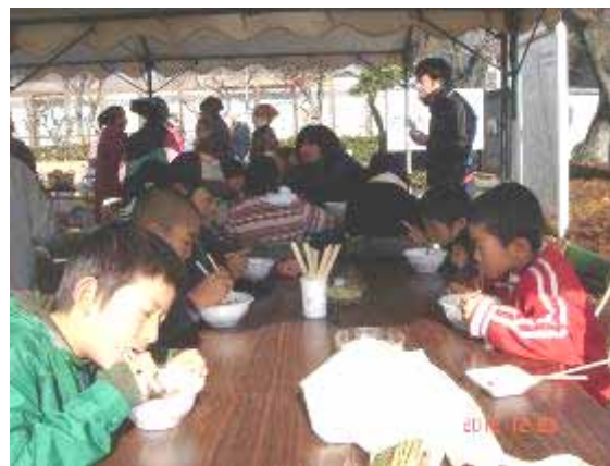
清里産のそばに舌鼓

子供たちや地区の人たちが「美味しかったよ」と声を掛けてくれるのが一番のうれしさだ。そば打ち会の人たちの昼食となり、無事終了となった。