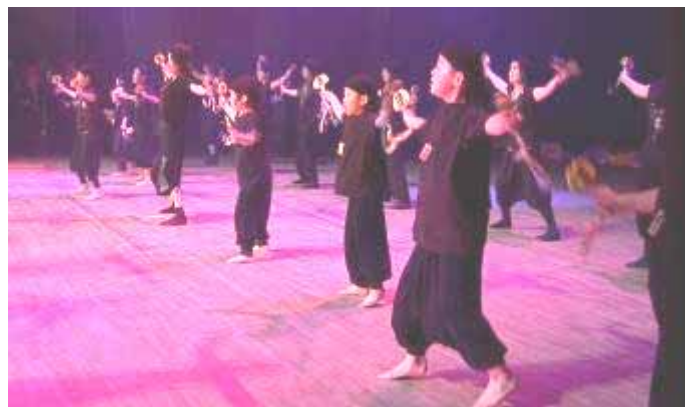
大きなホールの広いステージで躍動

コンテスト出場を賭けての抽選会で、怖くて引けない大人たちを尻目に豪快に抽選箱に手を入れてくれました。