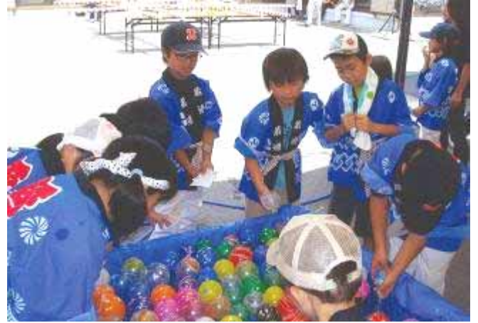
大人気のヨーヨーすくい

清野町では、10月14日の秋祭りに向けて、獅子舞の練習に取り組んでいます。練習を通し地域の絆がより一層深まり、大人も子どもも楽しみながら頑張っています。