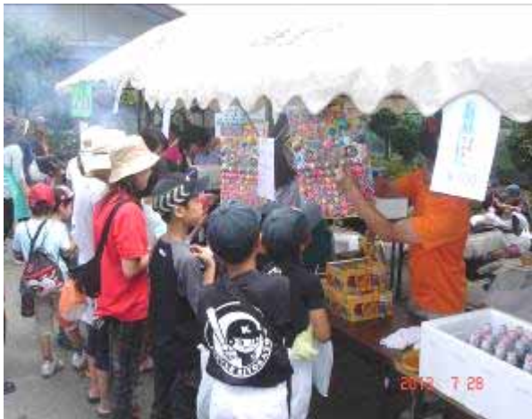
模擬店を楽しむ子どもたち