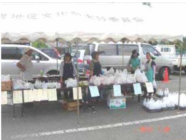
野菜売りのお姉さん