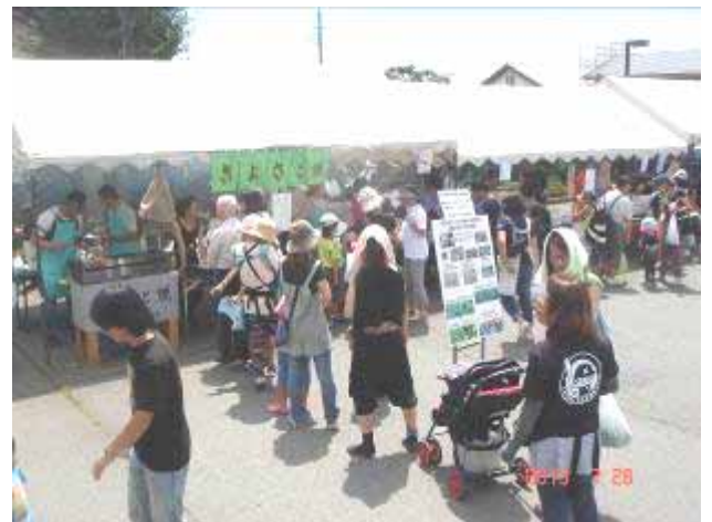
きよさと焼に長蛇の列

畑での枝豆収穫は出来ませんでした。収穫祭は盛大に行うことが出来ました。ホールでの枝豆収穫や、クイズ、だんべえ部会によるダンス披露など、多くの人を楽しんでもらう事ができました。