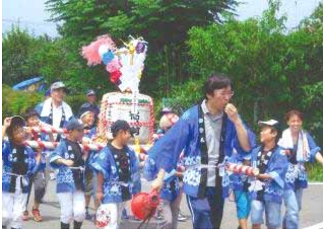
炎天下の子ども神輿