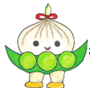
清里まちづくり協議会 公式キャラクター 『さとの子ちゃん』