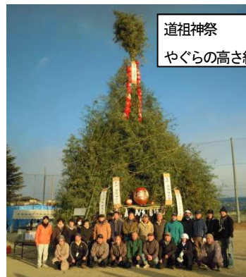
道祖神祭 やぐらの高さ約20m