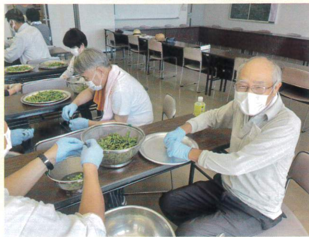
【手でさやから豆出し】