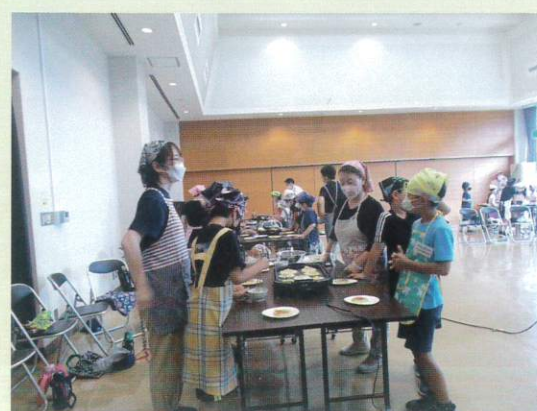
【きよさと焼できたよ】