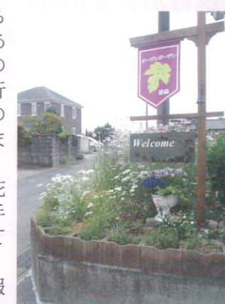
【オープンガーデンの旗】

コロナ感染症が落ち着いて、以前の様に安心して行事を行えるようになることを切に願っています。