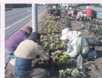
【花の手入れをする部会員】