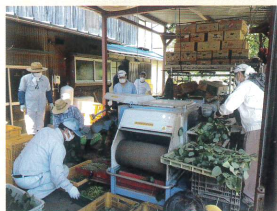
【機械を使ってもぎ取り】