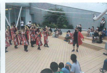
【2階屋外テラスで公演】