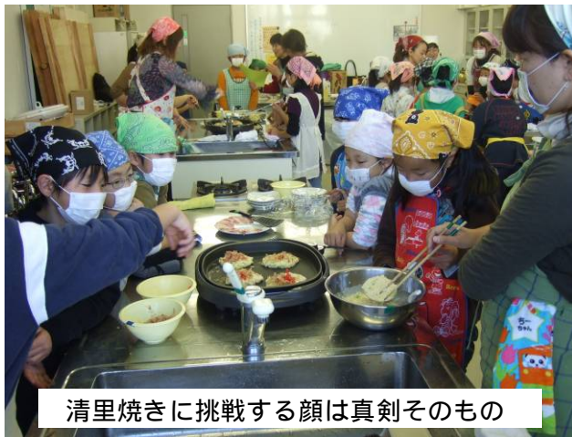
清里焼きに挑戦する顔は真剣そのもの

今日は清里焼きの作り方を教えてくれてありがとございました。ぼくは作り方を全く知らなくてざいりょうにえだ豆があるのも知りませんでした。でも今日食育部会の皆さんに作り方やざいりょうを教えてもらいました。今日は本当にありがとございました。