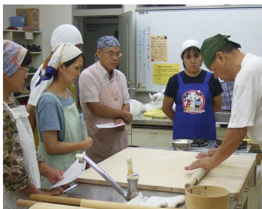
自主学习移行の「夜のそば打ち教室」

そして、会員の親睦を兼ねた「松本そばまつり」への小旅行が一大イベントでした。参加者十七名、松本の浅間温泉に一泊。翌日「素人そば打ち段位認定大会」の会場へ、三段位の認定会場は緊張した雰囲気。見学の皆が見守る中、始めの合図。静かな会場は、選