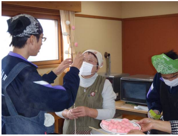
紅白のまゆ玉を小枝に飾りつける

今回も講座受講者に加えて、地元の青梨子町自治会長、役員や民生児童委員、主任児童委員もかけつけ生徒らと協力して、まゆ玉を作りました。