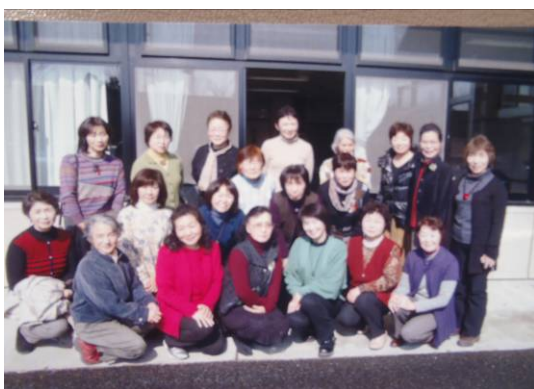
下川淵地区と花で交流会(2月9日)

「花はな花壇」が完成。今年度の活動の中心は、花壇づくりでした。竹と篠を使った土留め作業に