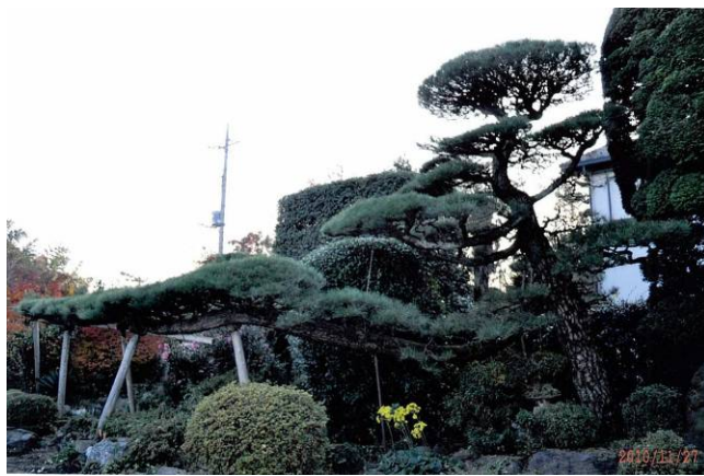
樹齢二百五十年のクロマツ