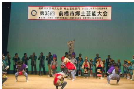
前橋市郷土芸能大会へ参加

くわの実 東日本大震災の犠牲者、被災者の方々に心からお見舞いを申し上げると共に一日も早い復興を願っている。群馬県は比較的に地殻変動も少なく安定しているが、歴史的に見ると大地震が発生している。有名なのは八一九年(弘仁九年)の大地震で渋川市半田地区内の工場建設に伴う遺跡調査で大きな地割れが発見されている。また、県内にはいくつもの活断層がある。災害は忘れた頃にやってくるといわれる。備えは万全にして被害は最小にと願う。 (照)