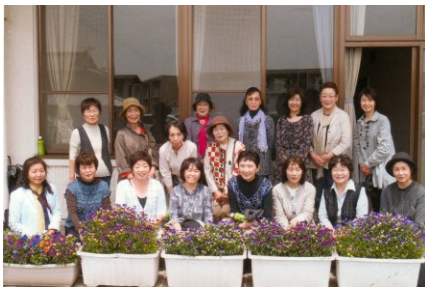
「花結びの会」の方々と 記念写真をパチリ!

清里公民館から「花はな花壇」までの道々には、アヤメやキンセンカなどの花がちょうど満開でした。その花を地域の方々が育てていることに大変驚いていました。「花はな花壇」もポピーやオルレアなどが華やかに咲いていましたので、「すっかり『花のまち』になっていますね!」と嬉しいことばをいただきました。(櫻井恭子)