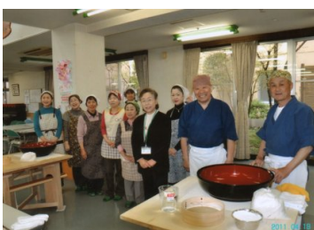
「ケアハウス前橋」での ボランティアそば打ち会