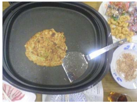
清里産の枝豆などを使用した「きよさと焼き」