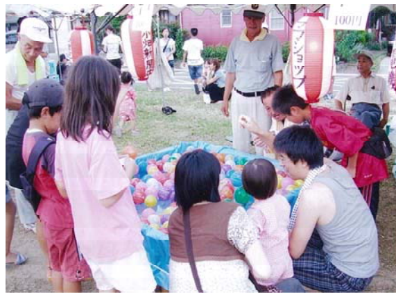
親子でヨーヨーつりを楽しむ(前原地区)

ーヨー・金魚すくい・トコロテン等が立ち並び、多くの人で賑わっていました。最後は大抽選会、一等から五等まで当たりくじ五十本を目指し、たいへんな賑わいのうち事故もなく終了することが出来ました。前原清寿会・青年会・野