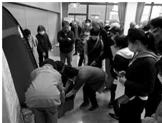
簡易トイレの組み立て訓練