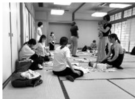
母親同士交流しながら学習