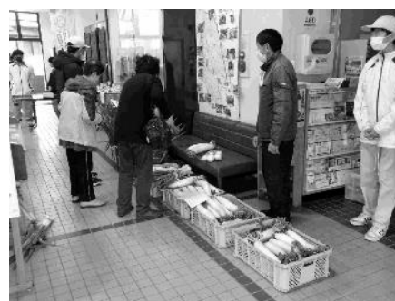
校外学習 野菜の販売