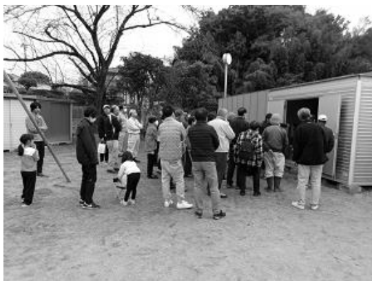
清里小学校内防災倉庫見学

また、訓練後の参加者アンケート結果では、防災講話に加え、応急救護・救出訓練や指定避難所開設・運営訓練を希望する方が多かったことから次回の訓練内容に活かしていきたい。