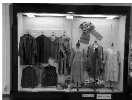
着物リメイク教室