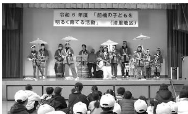
少年の日フェスティバル