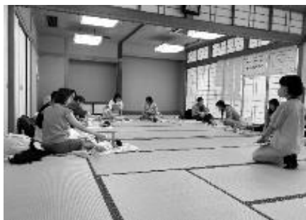
講師の説明を聞きながら実習

また、3館合同開催により共同し、事務分担や受付、実費徴収などスムーズに運営できた。