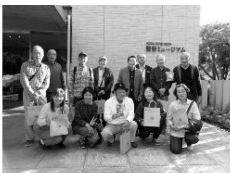
製粉ミュージアム

清里地区では、まちづくり協議会花いっぱい運動部会の花壇の手入れやオープンガーデンの取り組みが行われており、宝徳寺や足利フラワーパークの庭園の見学は、花いっぱいのまちづくりを一層深めるための参考となり、製粉ミュージアムや史跡金山城跡ガイド施設では歴史やその時代に生きた人々の知恵、その後明治に至るまでの変遷を詳しく知ることができ、今後生涯学習を進めるうえで大変有益であった。また、地区内各種団体役員との交流を深めることができた。