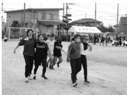
清里地区市民体育祭