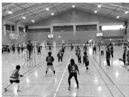
西部地区ソフトバレーボール