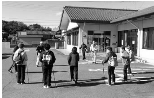
公民館駐車場での準備体操

昨年度に引き続きリピーターとして参加する方も多く、また、1回目の体験を経て2回目までに自前のポールを購入して参加した方もいるなど大変好評であった。清里地区内でポールウォーキング活動を行うグループが存在しないため、第2回目の講座では近隣の活動グループの紹介もしていただいた。参加者へのアンケート結果では歩行実技の距離をもう少し長くしてもらいたいとの意見もあったため、初級編と中級編のような区分けをして開催することも検討していきたい。