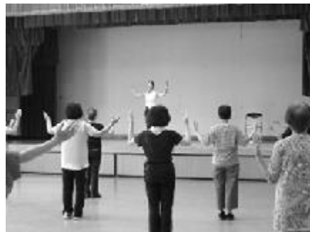
講師の先生の動きに合わせて体操