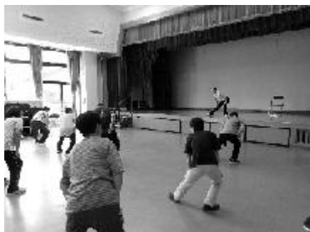
体操を始める前のストレッチ

先生が、ある程度の長さで曲を区切りながら体操を進めてくれて、細かい説明と動きで、参加者全員がリズムに乗った動きができていました。次回は、幅広い世代に参加してもらえるように、開催日等の検討をする。