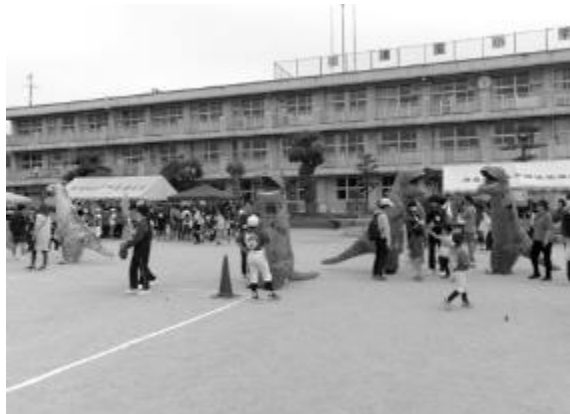
のびゆくこどものつどい