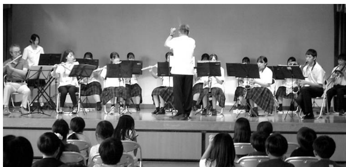
吹奏楽部のコンサートで非日常体験

参加者数は延べ205人となった。プログラミング体験は、清里生涯学習人材バンクの登録者に講師を依頼し、ゲーム作りを通して楽しみながら学べる点が好評だった。高校生ティーチャー講座では、前橋西高等学校の各部活動の部員が講師となって夏休みの宿題の対策や日常味わえない吹奏楽の演奏を楽しめる毎年人気の教室となっている。宿題に取り組む講座では教える側も指導を通じて自分自身を研鑽できたものと考えており、世代を超えての交流により社会性を育むよい機会となった。バルーンアートと料理教室では親子参加で楽しみ、夏休みの思い出の1ページを作る貴重な機会となった。