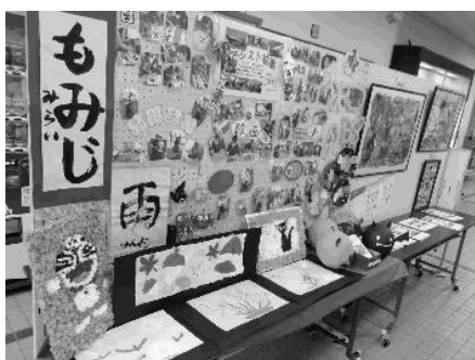
福祉事業所の作品