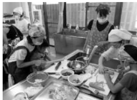
親子で夏休みの思い出作り