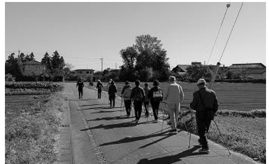
農道でウォーキング体験