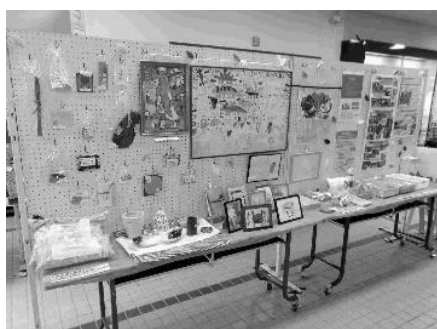
手をつなぐ作品展