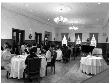
テーブルマナー講座