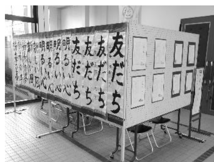
書初め作品の展示