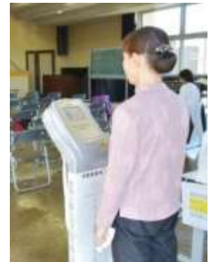
=体組成計による測定=

○申し込み 11月27日（金）までに永明市民サービスセンター（公民館）へ電話で申し込んでください。（住所、氏名、年代、連絡先をお願いします。） 【電話：266-5775】