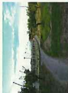
保健推進員お勤め ウォーキングマップ (梨畑の小道)