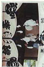
下長磯操繰式三番舞 (県指定無形文化財)