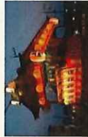
原町納涼祭の一幕 (キャンドルスローナイ)