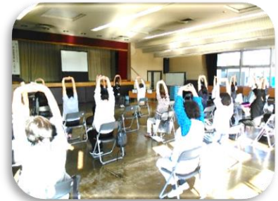
ストレッチの様子