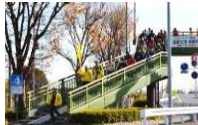
ルールを守って歩道橋