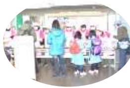
LPガスバルクを見学し tonton 汁へ =ゴール=