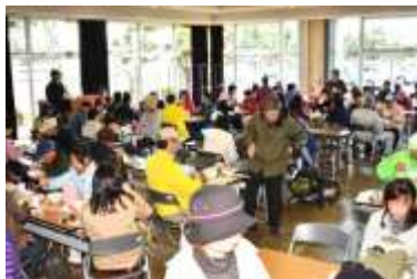
<tonton 汁と楽しい会話で心もホッカホカ>