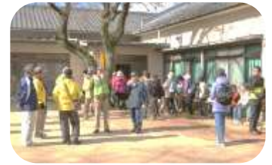
女屋町公民館で休憩